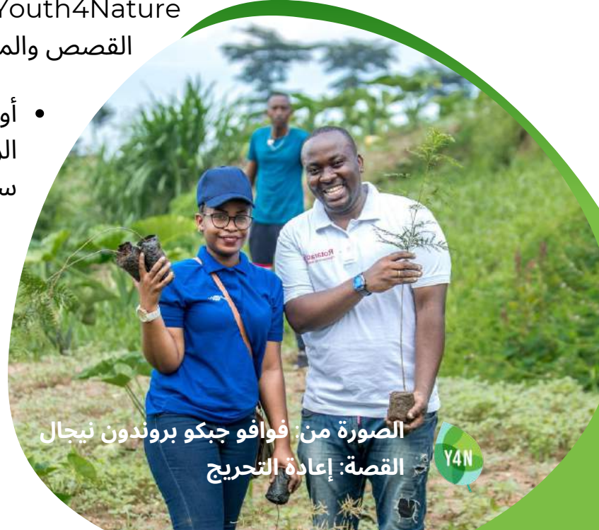
القصة: إعادة التحريج