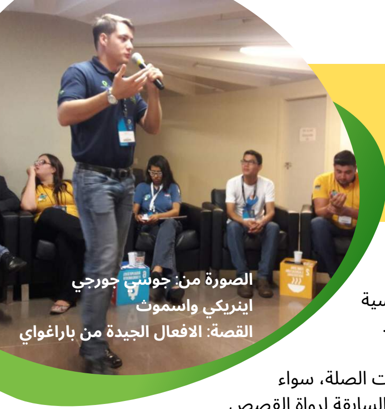
القصة: الافعال الجيدة من باراغواي

انضم الى (للأفراد) أو كن شريكًا (للمنظمات / المجموعات) في مجتمع رواية القصص العالمي التابع لـ Y4N، وهي شبكة عالمية داعمة من النشطاء الشباب وقادة المشاريع والخبراء والمهنيين الذين يقدمون: